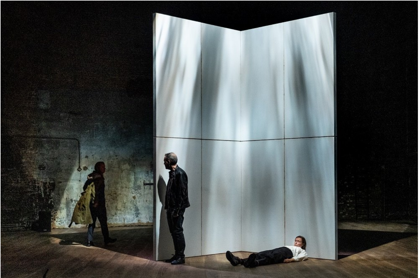
Stef Stessel © Stef Stessel

In een decor dat makkelijk in een kleine camionette past - twee witte wanden, elk bestaande uit vier platen, die een hoek van een kamer lijken te suggereren - tonen De Roovers waarin ze excelleren. Met niets in de handen, niets in de zakken en een mond vol perfect afgewogen woorden scheppen ze een universum waarin, in dit geval, vier mensen verloren lopen omdat die ene mededeling tot een heus sneeuwbaaleffect leidt. Want elke vriend interpreteert de mededeling op zijn manier. Elke vriend denkt dat hij (of zij) de oorzaak van dat vertrek is. Door die reacties leggen alle vrienden gaandeweg hun verborgen gevoelens en frustraties bloot.