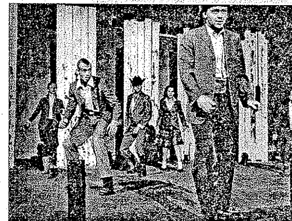
Het bühnebeeld dat Stef Stessel voor Blue-Remembered Hills heeft ontworpen, is verbluffend, het lichtplan efficiënt.

ONS OORDEEL: De Roovers zetten geen slechte voorstelling neer, maar struikelen over de kinderroletjes, met een al te vlak acteer spel als gevolg.