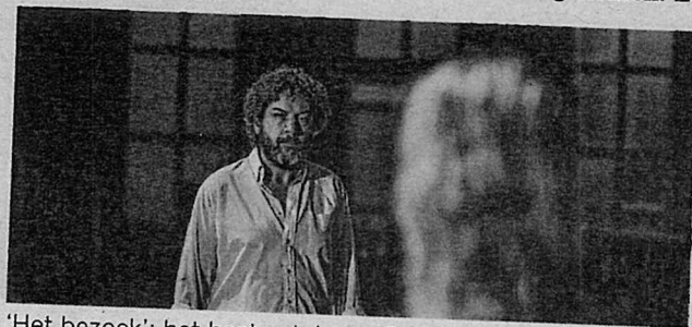
'Het bezoek': het beste stuk van De Roovers in jaren.

De opwindende over haar terugkomst maakt algauw plaats voor opschudding. Madame Claire is immers niet zomaar gekomen. Ze