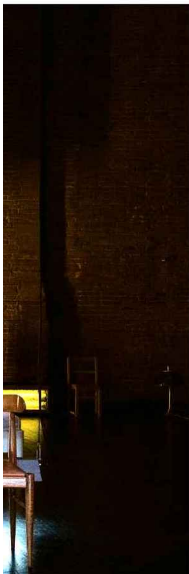
définir une héroïne.